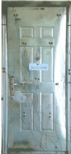
照片 2 耐火试验结束时试件情况